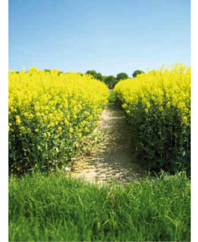
Rapsblüte (Versuchsfläche Süd)