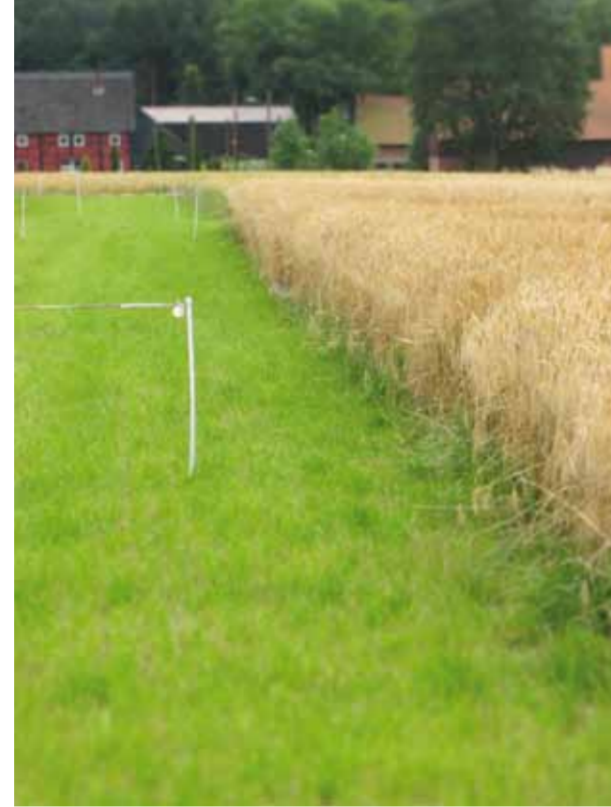
Getreideparzelle vor der Ernte (Versuchsfläche Süd)