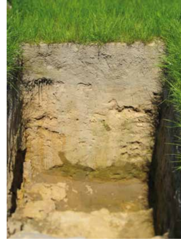
Bodenprofil (Versuchsfläche Nord)