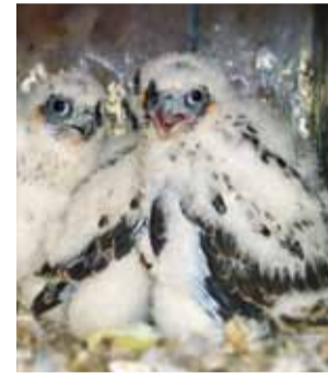
Gesichtet Falken nisten am Kraftwerk