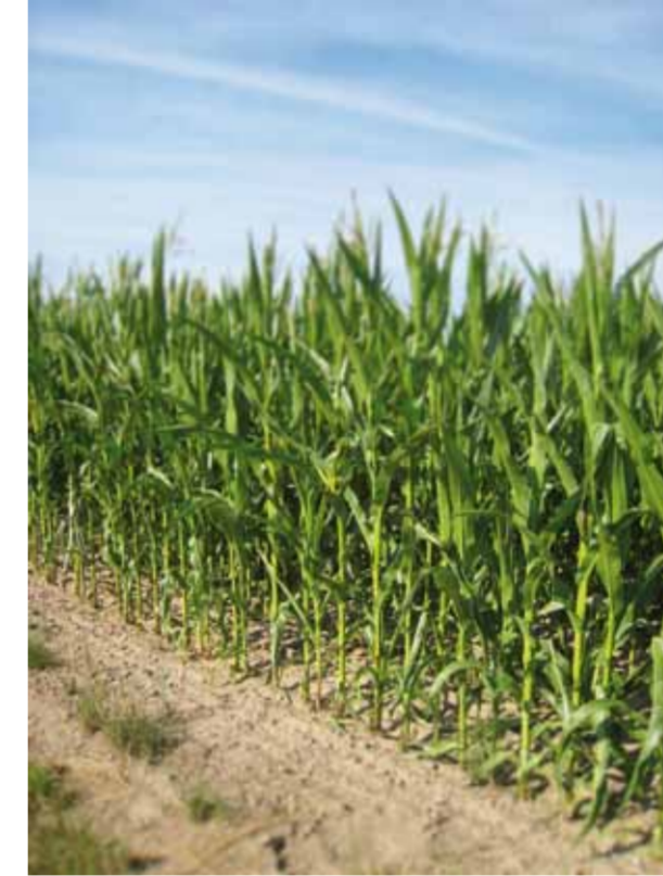
Maispflanzen (Versuchsfläche Nord)