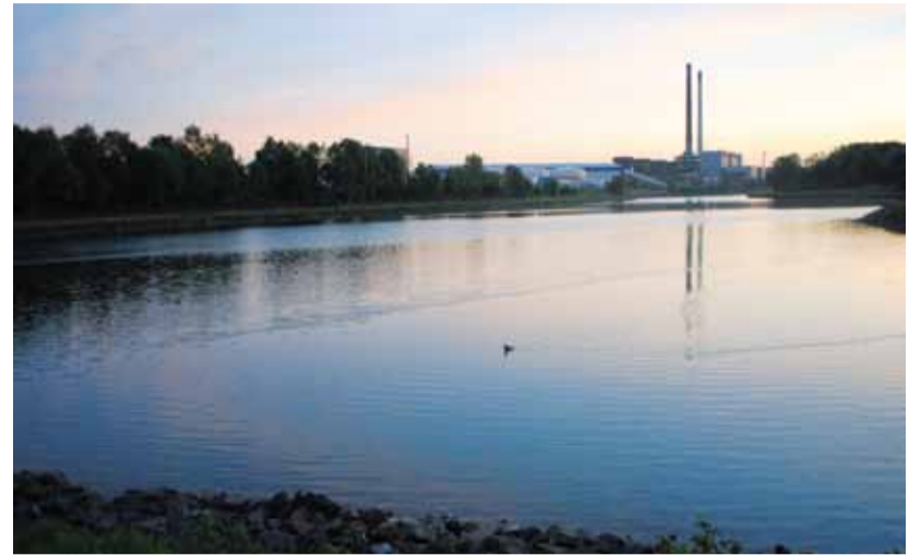
Kraftwerke im Morgengrauen - „Auch wenn das neue Kraftwerk das Bild der Umgebung sehr verändert, kann es auch schön aussehen“, schrieb neben.an Leserin Rosemarie Riley-Lange zu ihren stimmungsvollen Aufnahmen des neuen Kraftwerks Datteln 4 und des bestehenden Bahnstromkraftwerks.