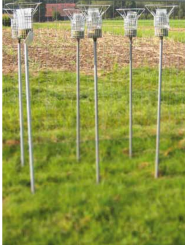
Staubniederschlag-Sammelgefäße (Versuchsfläche Nord)