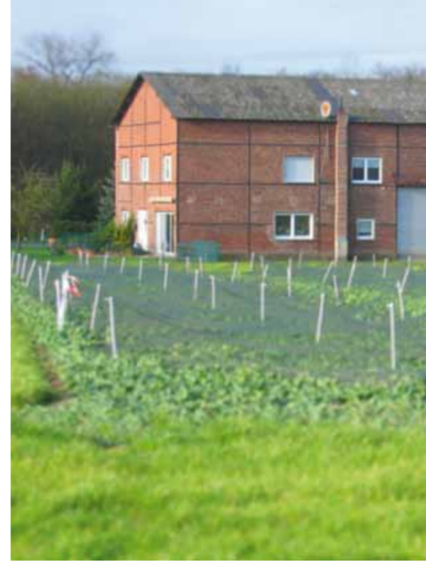
Rapsparzelle (Versuchsfläche Nord)