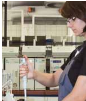
Geprüft Besuch im Zentrallabor